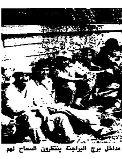
مسلحون في منطقة مخيم برج البراجنة